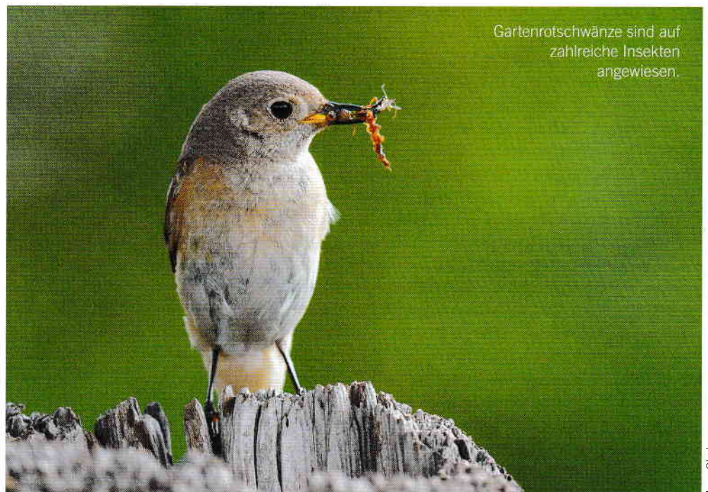
Gartenrotschwänze sind auf zahlreiche Insekten angewiesen.